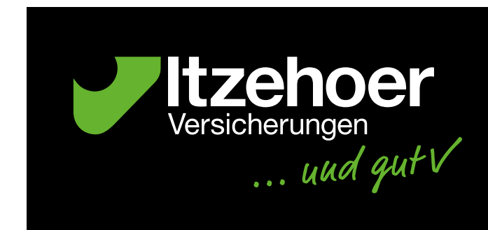
negativ + grün