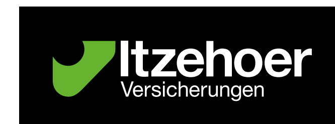
negativ + grün